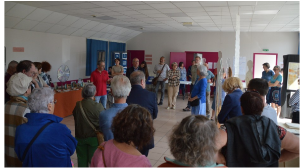
Les talents de Lanloup