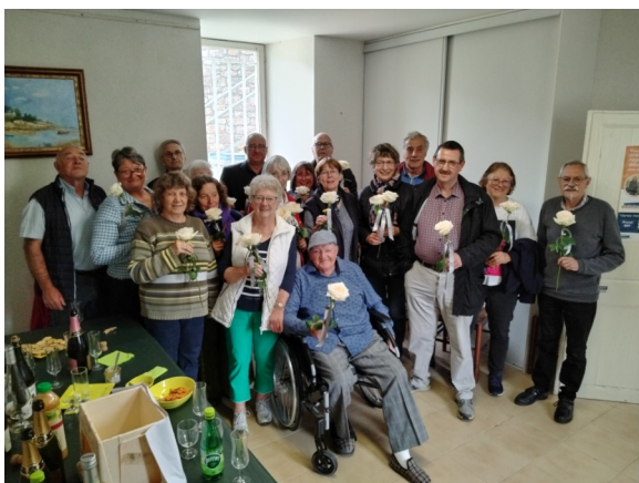
Fête des pères et des mères