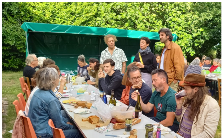
Fête de la Saint Jean