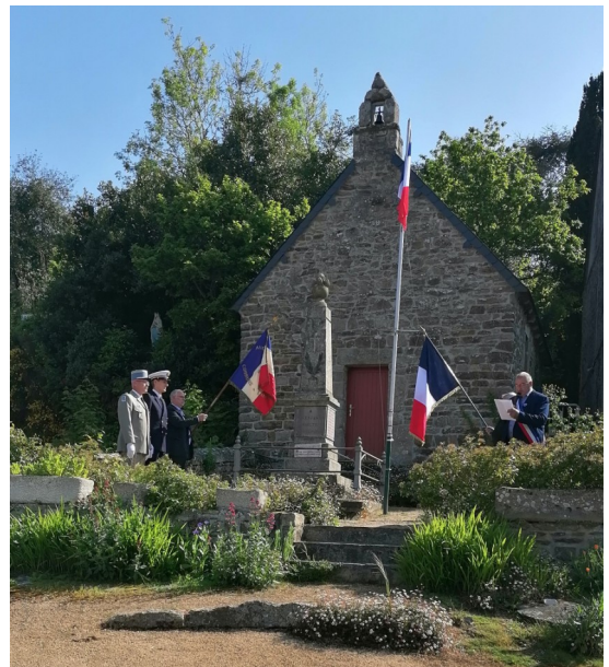
8 mai à Lanloup